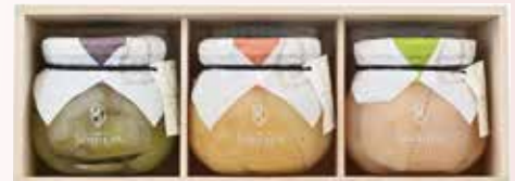
ピオーネ、白桃、ル レクチエ 各1個 桐箱入