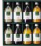
8本 化粧箱入 ぶどう 2本 りんご、みかん 各3本