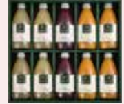
10本 化粧箱入 ぶどう 2本 りんご、みかん 各4本