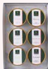
アイスクリーム詰合せ

果実の扱い方を熟知した千疋屋総本店だからこそその技を使って、美味しさを閉じ込めました。厳選されたフルーツの素材で作られた人気のアイスクリーム詰合せです。