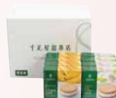
アイスクッキーサンド詰合せ