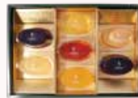
7個 化粧箱入 白桃、さくらんぼ、伊予柑、 ラフランス、ふじりんご 各1個 ピオーネ 2個