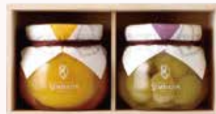
黄金桃、ピオーネ 各1個 桐箱入

千疋屋総本店自慢の大きな果実をふんだんに使った、フルーツが主役の贅沢なジェリー。果物の美味しさを引き出すよう、甘さを抑えたこだわりの一品です。