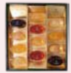
12個 化粧箱入 白桃、ピオーネ、さくらんぼ、伊予柑、ふじりんご、 ラフランス 各2個